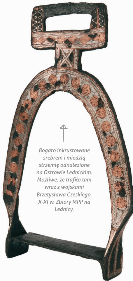
Bogato inkrustowane srebrem i miedzią strzemię odnalezione na Ostrowie Lednickim. Możliwe, że trafiło tam wraz z wojskami Brzetysława Czeskiego. X-XI w. Zbiory MPP na Lednicy.

← Zatopiona łódź i pozostałości spalonych w 1038 r. mostów. Wszystko wydobyte z wód Jeziora Lednickiego, zakonserwowane i wyeksponowane w MPP na Lednicy.